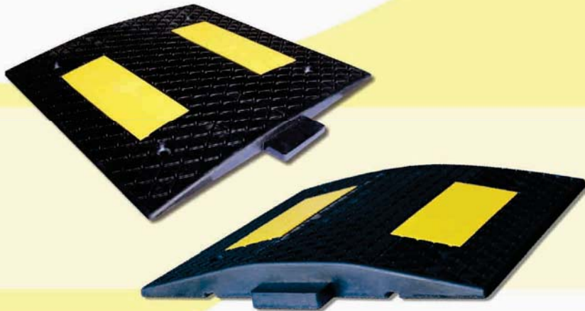
Reductor de velocidad 50x50x3 cm. Ref.01030 50x50x5 cm. Ref.01040