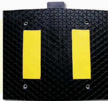
Reductor de velocidad 60x50x5 cm. Ref.01050 60x50x3 cm. triangulo Ref. 01060