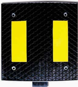
Reductor de velocidad 40x50x3 cm. Ref.01010